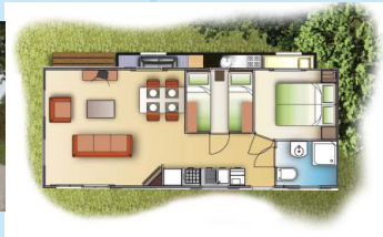
Typ 3 ORLANDO