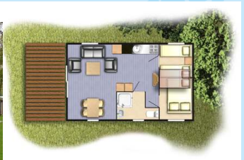
Typ 4 KAJÜT-LODGE